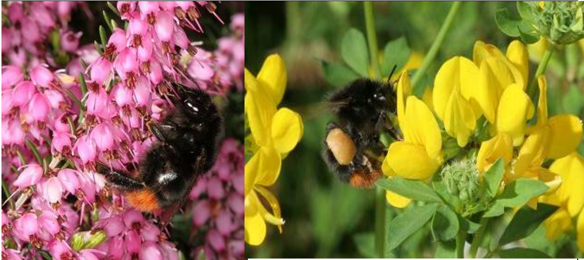
Bombus lapidarius , an Erika, Steinhummel, Quelle Internet