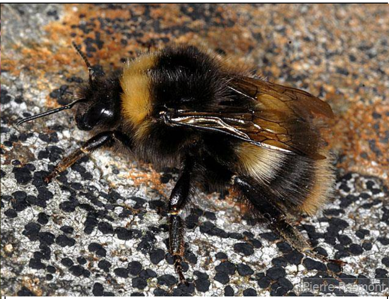
Bombus pratorum Female auteur(s) : Pierre Rasmont Scotland, Quelle Internet