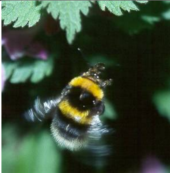
Fliegende Gartenhummel-Königin, Bombus hortorum · Salzburg Elixhausen