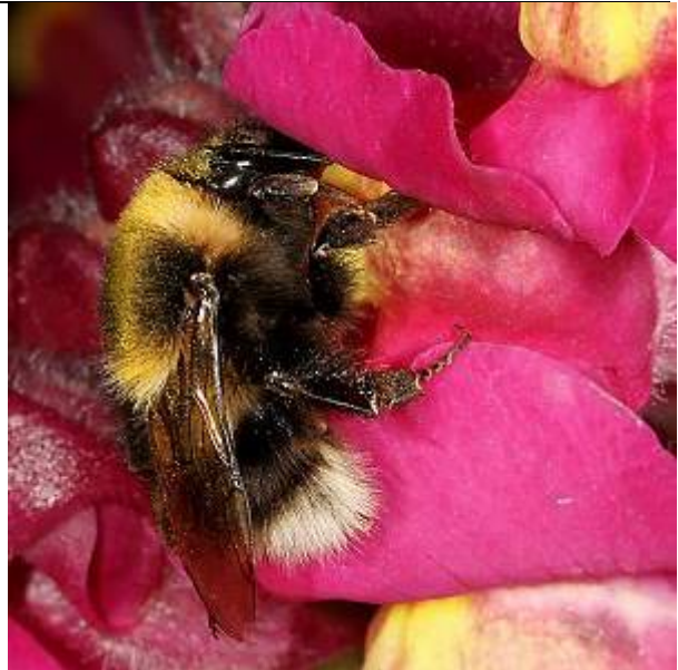
Gartenhummel ( Bombus hortorum), Schlafende Königin · Gronsveld (Maastricht, NL), 17.05.2012