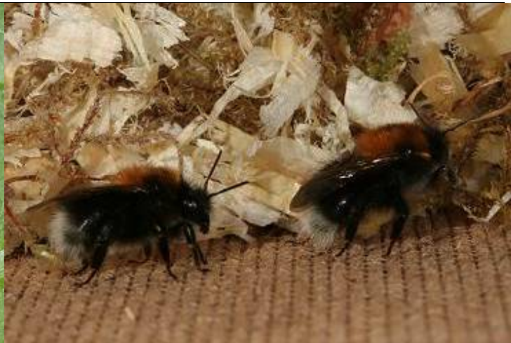
Blick in einen Baumhummel-Nistkasten · Solingen, 13.5.2007