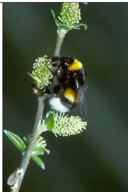
Bombus lucorum , an Salix nigricans Salzburg, Zell/ Wallersee