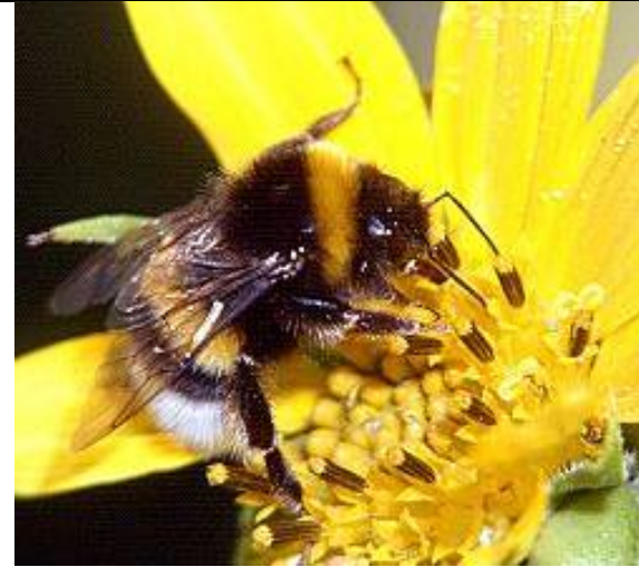
Männchen an Helianthus annuus · Salzburg, Elixhausen, Sept 2003, Quelle Internet

Die „Dunkle Erdhummel“ gehört zu den auffälligsten, größten und häufigsten Hummelarten, Bombus terrestris