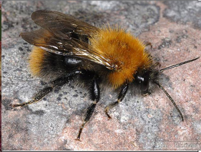
Bombus pascuorum sparrceanus Male auteur(s) : Pierre Rasmont Sweden, Jämtland, Quelle Internet