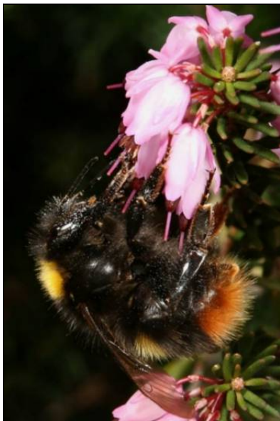
Wiesenhummel, Bombus pratorum