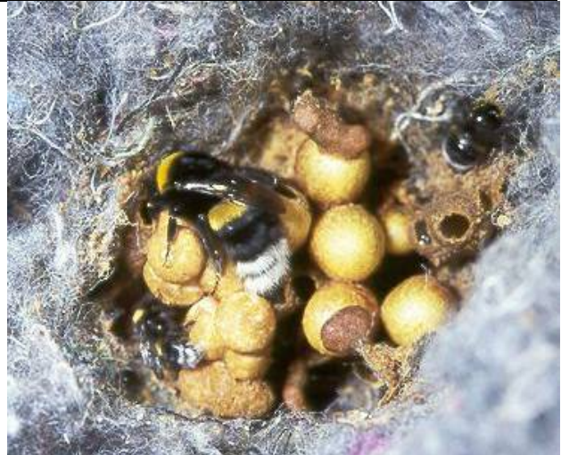
Bombus terrestris Eine Königin auf ihrem Nest; Salzburg, Elixhausen, 2003