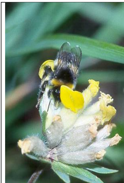
Bombus lucorum , an Anthyllis vulneraria Salzburg Tweng