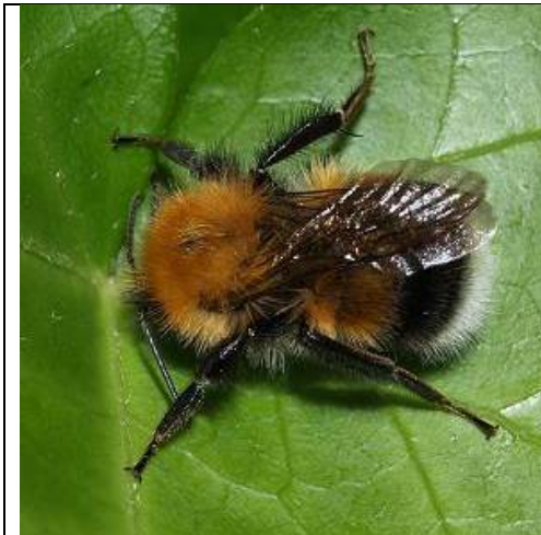
Bombus hypnorum, · 27.6.2006