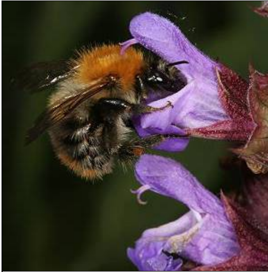
Bombus pascuorum, an Salbei Salvia officinalis, Solingen, Bot. Garten, 20.5.2007